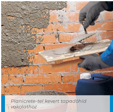
Planicrete-tel kevert tapadóhíd vakolathoz