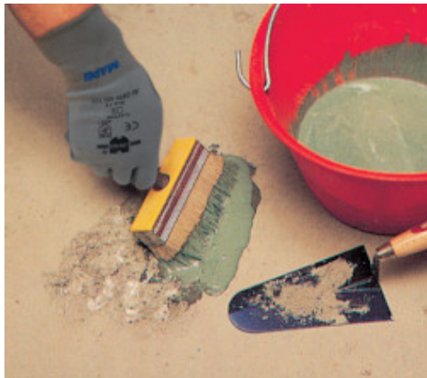
Padlójavítás: a tapadóhíd felhordása