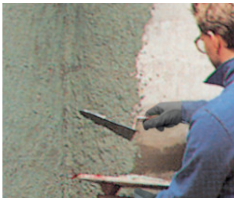
Planicrete-tel kevert vakolati tapadóhíd