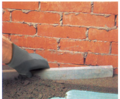
Planicrete-tel készített cementkötésű esztrich felhordása