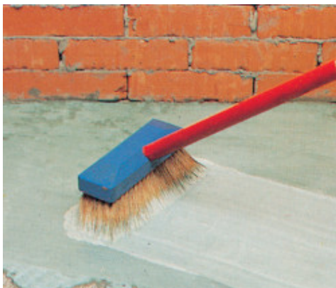
Planicrete-tel készített cementkötésű habarcs felhordása