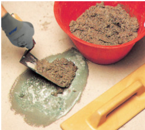
Padlójavítás: a habarcs felhordása