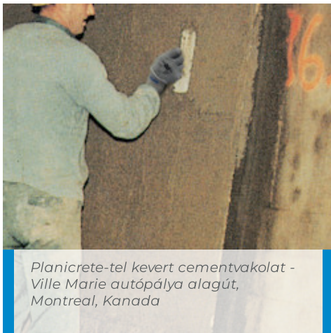
Planicrete-tel kevert cementvakolat - Ville Marie autópálya alagút, Montreal, Kanada