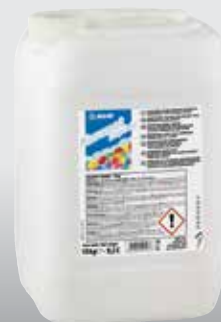
A Keranet folyadék kannában és palackban is kapható

A termékre vonatkozó referenciák kérésre rendelkezésre állnak, illetve a www.mapei.hu weboldalon hozzáférhetők.