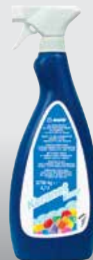
A Keranet Easy 0,75 literes szórófejes palackban kapható