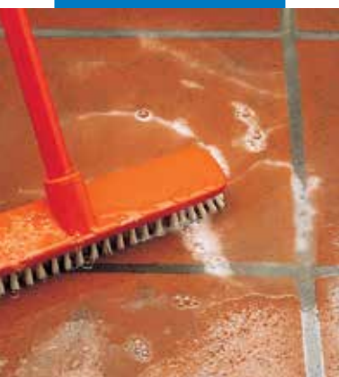
Folyékony Keramet tisztítása tisztítókefével