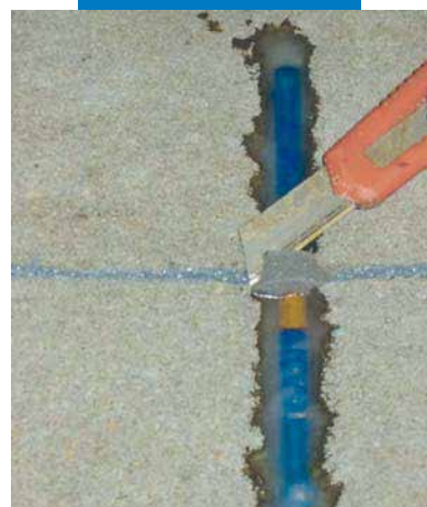
A padlószinten túlnyúló expanziós hab levágása