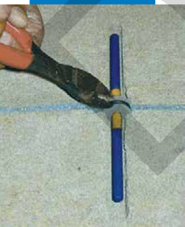
A feszítőgyűrű eltávolítása az expanziós habról