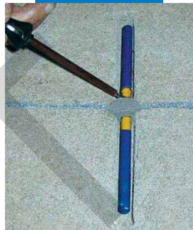
Az esztrich dilatációs dübel beillesztése a helyére

A termékre vonatkozó referenciák kérésre rendelkezésre állnak, illetve a www.mapei.hu weboldalon hozzáférhetők.