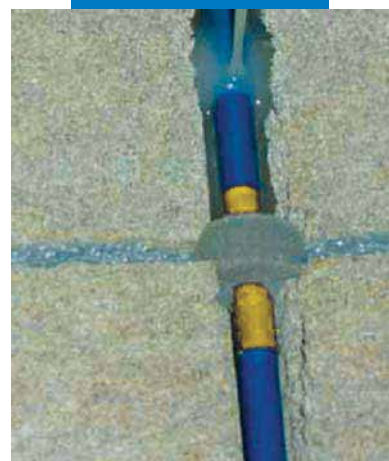
A dübel kiöntése