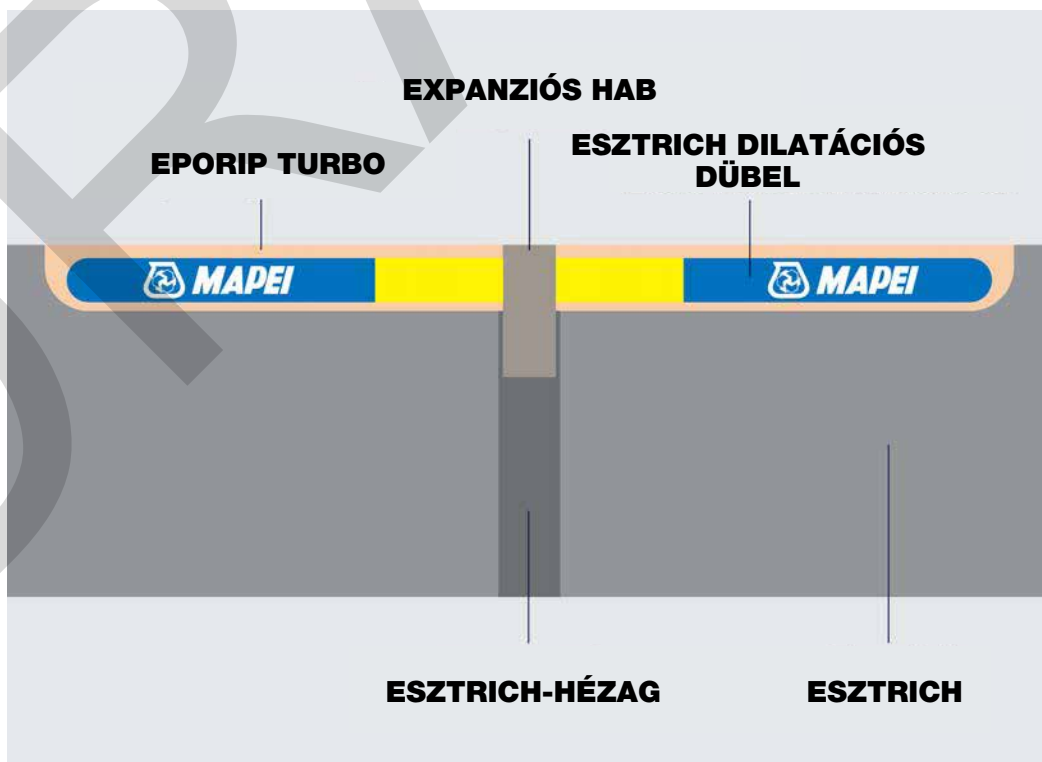
Az esztrich dilatációs dübel utólagos beszerelésének vázlatos ábrázolása