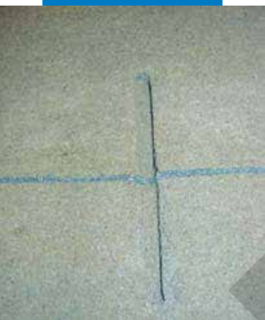
A dübel fogadására kialakított hézag