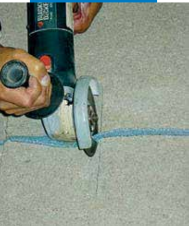
A dübel helyének kivágása esztrich tágulási hézagjára merőlegesen