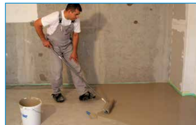
A homogénre kevert aljzatkiegyenlítőt vödörből végzett terítéssel hordjuk fel a megfelelően előkészített aljzatra.