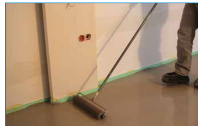
Tuskés hengerrel dolgozzuk át a frissen felhordott önterülő aljzatkiegyenlítőt.