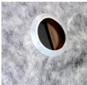
A fóliagyűrű beépítése