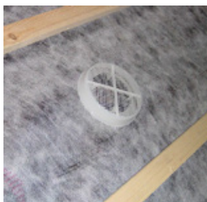
Bepattintható rácsos fedél felszerelve