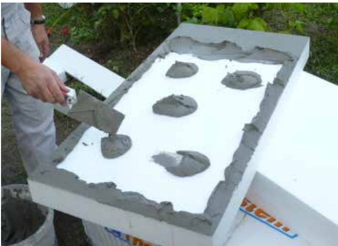
Rendszerragasztó kézi felhordása pont-perem módszerrel

Kézi felhordás esetén a ragasztót a hőszigetelő tábla hátsó oldalára "pont-perem" módszerrel hordjuk fel oly módon, hogy a ragasztó fedje körben a tábla hátsó szélét és még 5 pontban borítsa a hátsó oldalát.