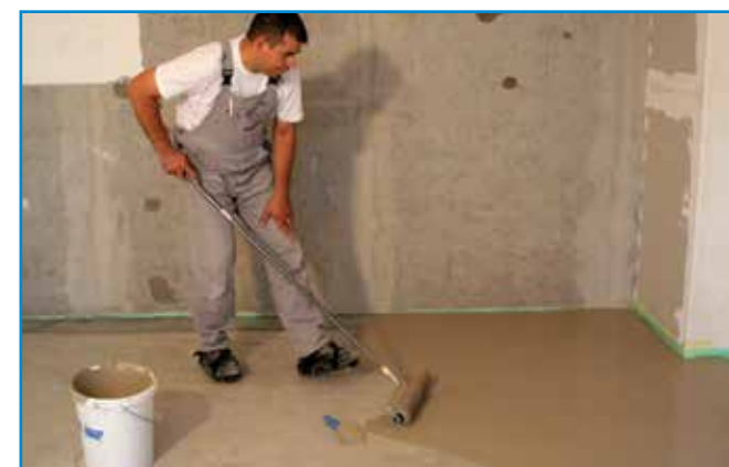
A homogénre kevert aljzatkiegyenlítőt vödörből végzett terítéssel hordjuk fel a megfelelően előkészített aljzatra.