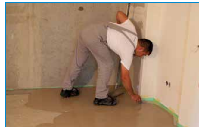
Az anyag terülését a sarkoknál simítóval vagy kőműveskanállal segítjük.

Szerszámok: rozsdamentes acél simító, tuskéhenger, kőműveskanál