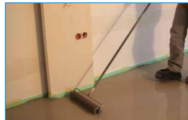
Tuskés hengerrel dolgozzuk át a frissen felhordott önterülő aljzatkiegyenlítőt.