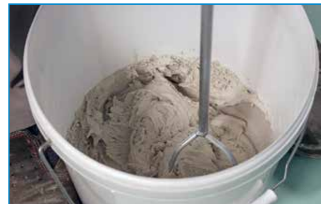
A fugázóanyagot a pontosan kimért komponensek hozzáadásával csomómentesre keverjük.

Bedolgozhatósági idő: Az anyag a bekeverés befejezésétől kb. ennyi ideig használható fel (átkeverés szükséges lehet)