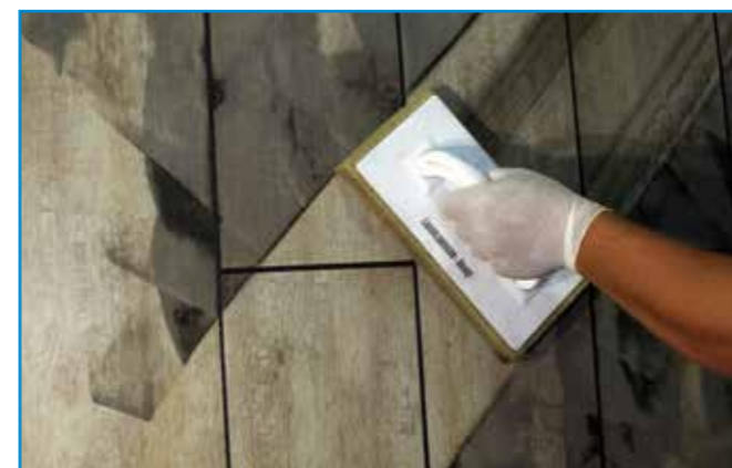
A felesleges anyagot lemosó szivaccsal távolítjuk el a felületről.