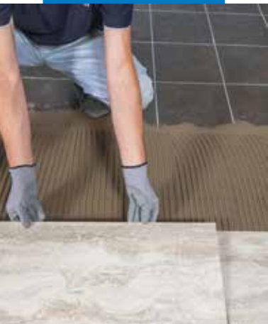
Kő hatású padlóburkoló lapok fektetése meglévő padlóburkolatra