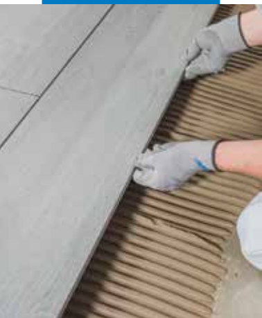
Fa hatású burkolólapok fektetése Mapelastical vízszigetelt aljzatra