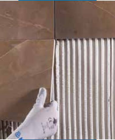
Kerámia fal csempe ragasztása