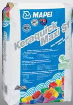
Keraquick Maxi S1 fehér - ultrafehér