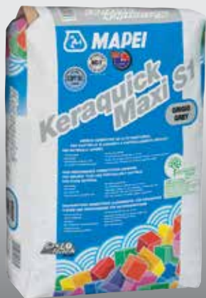
Keraquick Maxi S1 szürke