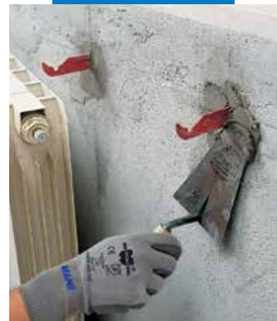
Radiátor konzoljainak rögzítése Lampocem-mel