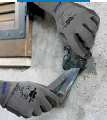
Ablak horgonycsavarjának rögzítése Lampocem-mel