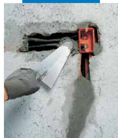
Elektromos csövezés és dobozok rögzítése Lampocem-mel