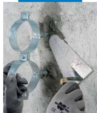
Csőkonzol rögzítése Lampocem-mel