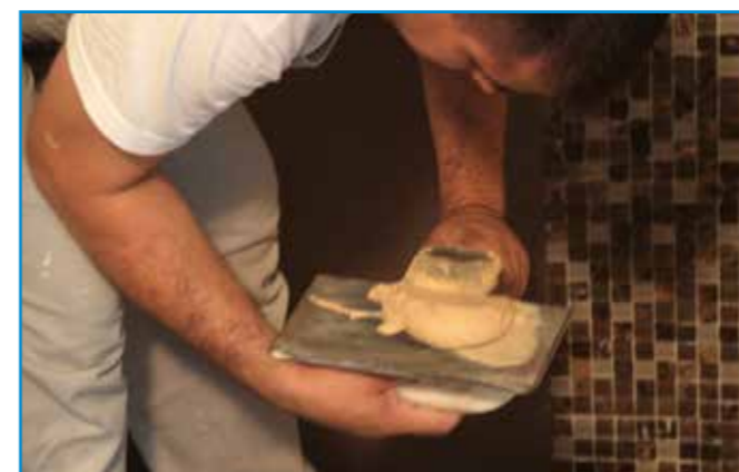
A fugázóanyagot speciális fugázó simítóval juttatjuk a fugákba.