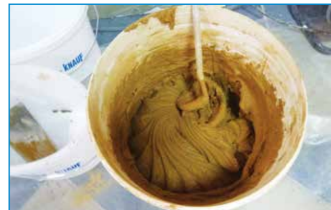
A fugázóanyagot a pontosan kimért víz hozzáadásával csomómentesre keverjük.

Tisztítás: A megszilárdult, fugázott felületek az első hetekben csak tiszta vízzel tisztíthatók.