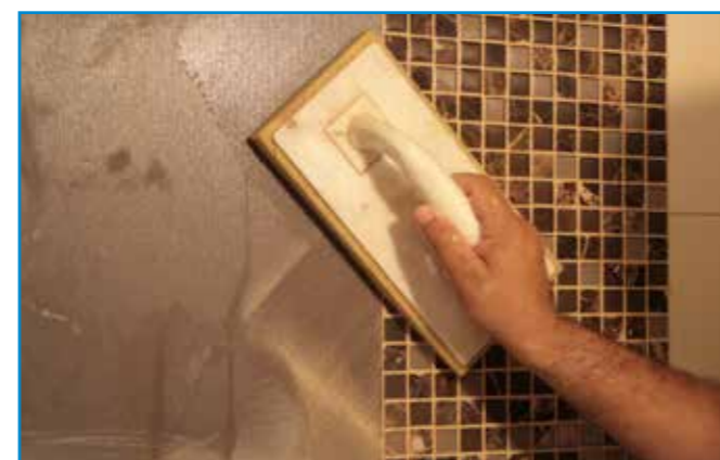
A felesleges anyagot lemosó szivaccsal távolítjuk el a felületről.