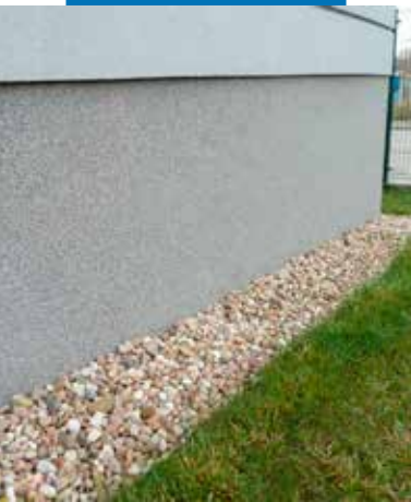
Homlokzatra felvitt Mape-Mosaic

Ajánlott először vízzel megtisztítani a régi vakolatot. A friss vakolatok legyenek teljesen kötöttek és érlelték. Az esetleges felületi hibák, repedések javításához és lezárásához a Mapetherm habarcsokat használja. Az alapfelületet a vakolat színével megegyező Quarzolite Base Coat -tal alapozza, legalább a Mape-Mosaic felvitele előtt 12-24 órával. A Mape-Mosaic felhordható nemszívó, egységes, jól tapadó festékréteggel előzetesen bevont felületeken is, ezért közvetlenül felvihető azokra. A Mape-Mosaic felvitele előtt ajánlott minden egyéb elem, pl. ablakkeret, burkolt felületek védelméről gondoskodni.