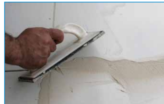
A fugázóanyagot a burkolólapok átlójának irányában hordjuk fel.

Tisztítás: A megszilárdult, fugázott felületek az első hetekben csak tiszta vízzel tisztíthatók.