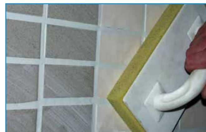
A lemosószivacsot enyhe nyomással húzzuk végig a felületen.