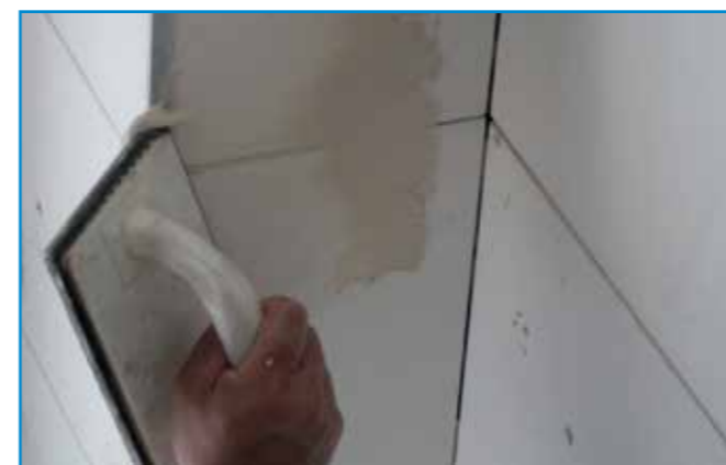
A csatlakozó profilok mentén is használjunk fugázóanyagot!