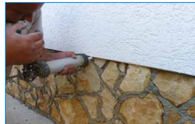
A fugázó anyagot fugázó kanállal vagy kinyomópisztollyal juttatjuk a helyére.

Tisztítás: A burkolatokat lehetőleg a ragasztó száradása előtt, folyamatosan nedves ruhával tisztítsuk.