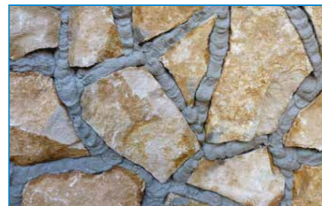
Rövid várakozás után a felesleges anyagot eltávolítjuk.