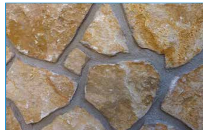
Amikor az anyag kellően meghúzott, ecsettel vagy kefével homogenizáljuk a fugák felületét. A köveket a fugázó teljes megkötése előtt tisztítsuk meg!