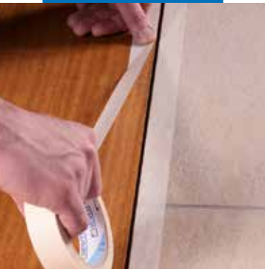
Védőszalag felragasztása a hézag szélére