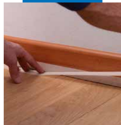
Védőszalag felragasztása a hézag szélére

A termékre vonatkozó referenciák kérésre rendelkezésre állnak, illetve hozzáférhetők a www.mapei.hu és www.mapei.com honlapokon