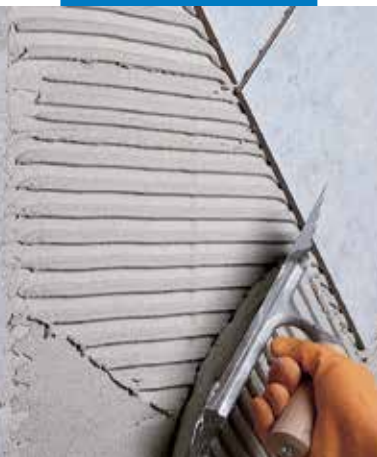
Egyszer égetett burkolólap ragasztása gázbeton falra