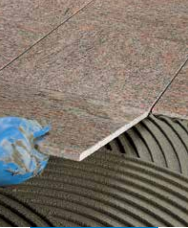
Polírozott márvány burkolólap ragasztása padlóra

A hő- vagy hangszigetelő táblák Keraflex -szel történő ragasztásához használjon vakolókanalat vagy simítót.