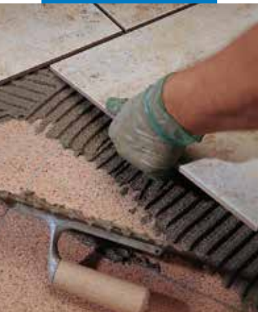
Egyszer égetett burkolólap ragasztása terrazzo burkolatra kültéri falon