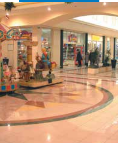
Példa porcelán lapok ragasztására – Zanchetta Shopping Center – Treviso (Olaszország)

A termékre vonatkozó referenciák kérésre rendelkezésre állnak, illetve hozzáférhetők a www.mapei.hu és www.mapei.com honlapokon